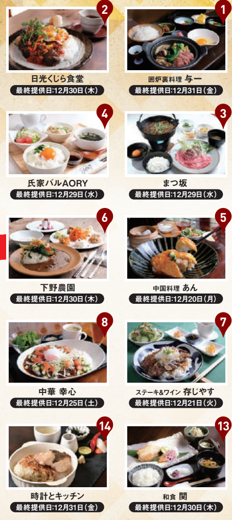
最終提供日:12月30日(木) 最終提供日:12月30日(木) 最終提供日:12月31日(金) 最終提供日:12月29日(水) 最終提供日:12月20日(月) 最終提供日:12月30日(木) 最終提供日:12月21日(火) 最終提供日:12月25日(土) 最終提供日:12月29日(水) 最終提供日:12月30日(木) 最終提供日:12月28日(火) 最終提供日:12月30日(木) 最終提供日:12月31日(金) 最終提供日:12月30日(木)

最終提供日が変更になる場合がございます。営業状況は直接店舗へお問い合わせください。