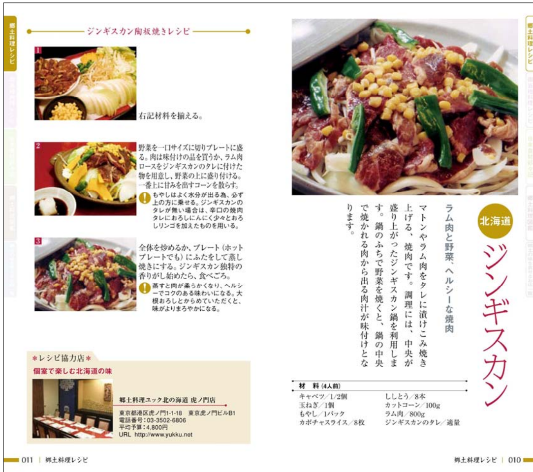
レシピ紹介ページの例（北海道：ジンギスカン）